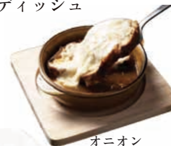
オニオン グラタンスープ