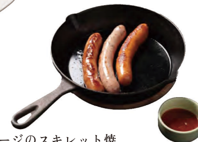
軽井沢ソーセージのスキレット焼