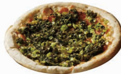
自家製野沢菜のピザ