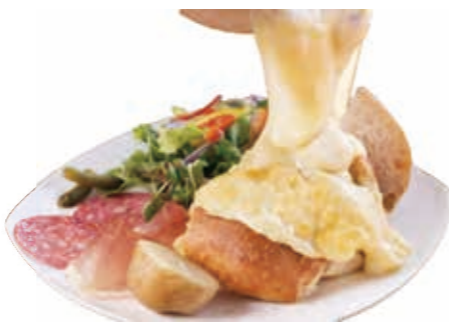
ラクレットチーズランチ