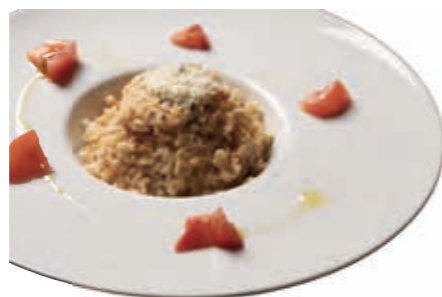
トマトのチーズリゾット