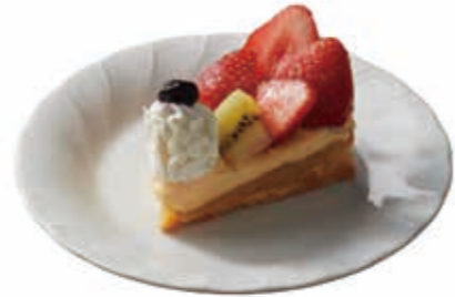
フルーリーの手作りケーキ *ケーキの種類はショーケースをご覧ください