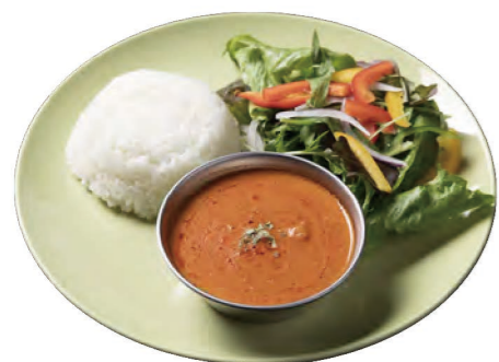
バターチキンカレー