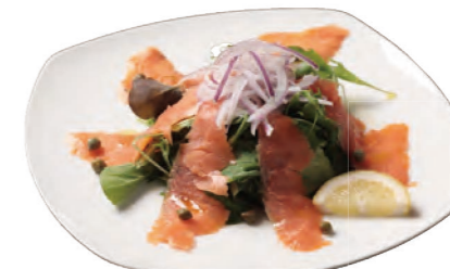
スモークサーモン