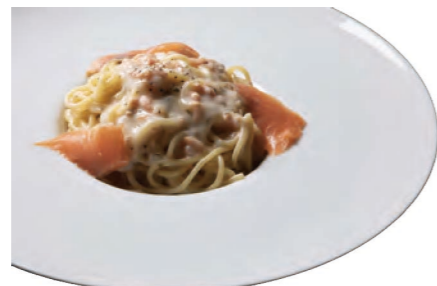
サーモンのクリームソース