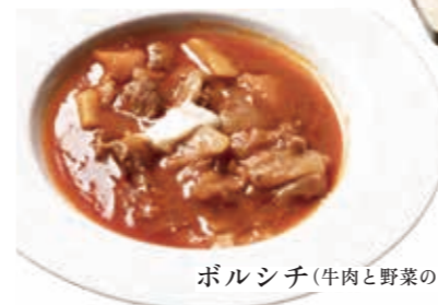
ボルシチ(牛肉と野菜のスープ)