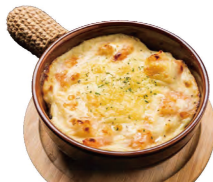
ラクレットチーズの海老ドリリア