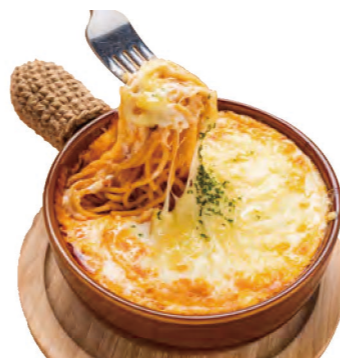
ミートソースの スパゲッティグラタン