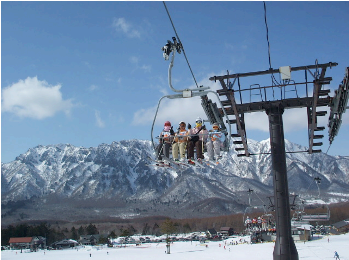
戸隠スキー場第 3 クウッドリフト