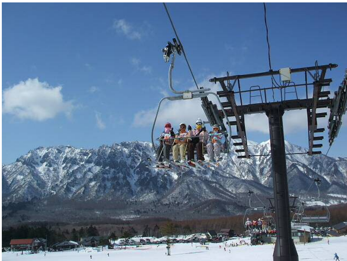
戸隠スキー場第3クワッドリフト